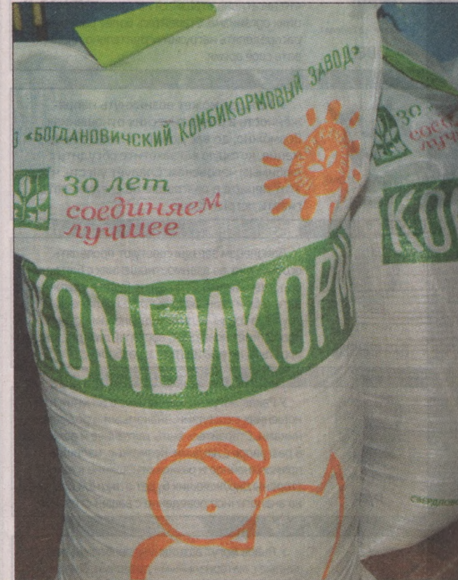
С кормами у предпринимателя проблем нет