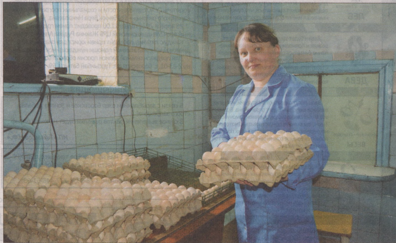
Мендыкаринский инкубатор начал работу в 2001 году

Сейчас работа на инкубаторе носит сезонный характер, примерно с апреля по июль. Здесь трудится сам индивиду-