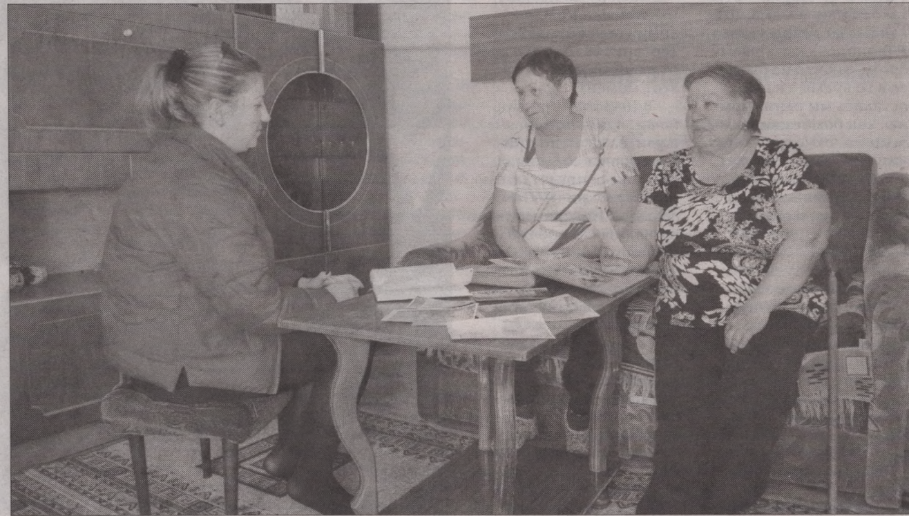
Дочери ветерана Любовь и Надежда рассказывают о своем отце со слезами на глазах

- Мы выросли в замечательной атмосфере, родители воспитывали нас так, чтобы мы всегда были поддержкой и опорой друг для друга. Когда были живы родители, мы любили собираться все вместе