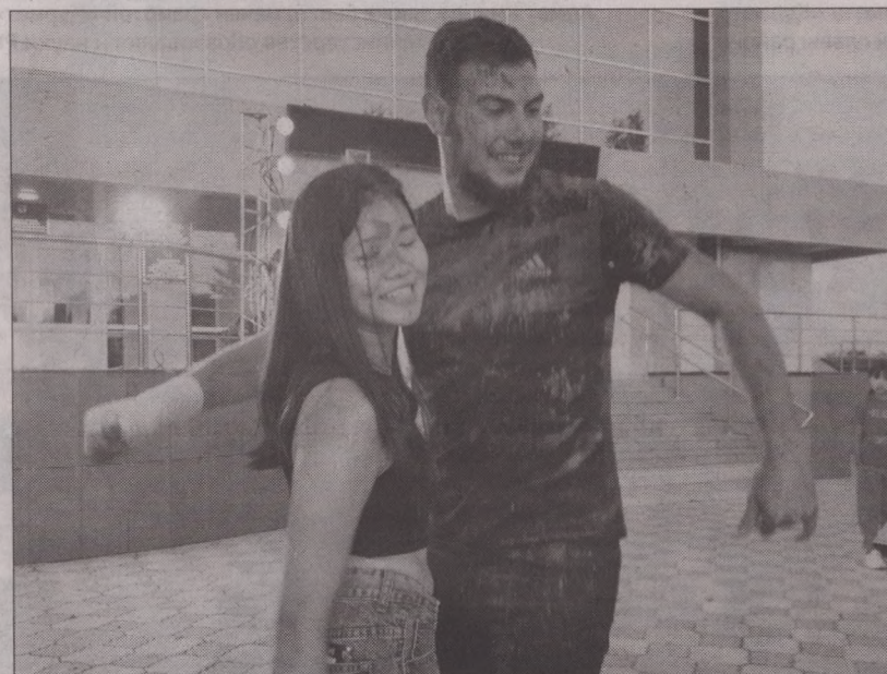
Молодежь района активно участвовала в различных конкурсах с применением цветного порошка