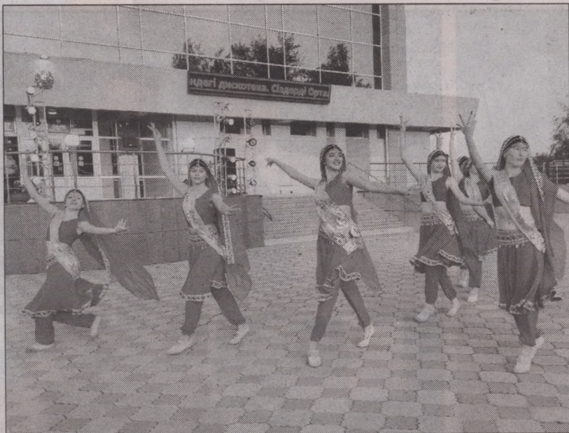
Издrevле фестиваль красок отмечали в Индии в сопровождении танцев и песен, что и продемонстрировал хореографический коллектив «Жулдыз» на площади с.Боровское