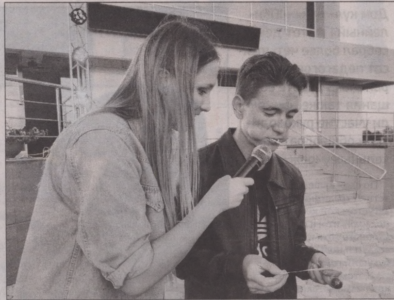
Конкурсанты поздравляли присутствующих с праздником с наполненным чупа-чупсами ртом