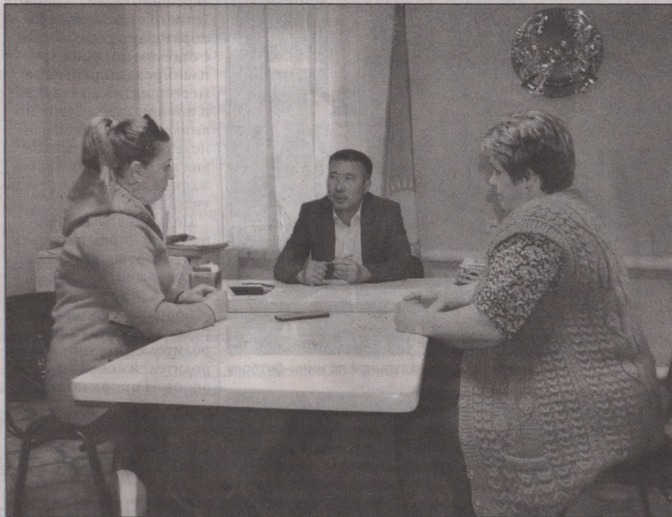
По словам акима, в этом году в рамках программы «Ауыл - Ел бесігі» в селе проводится укладка асфальта на трех улицах

В Алешинский сельский округ входят села Алкау, Алешинка и административный центр - село Молодежное. Общая численность населения - 1197. На территории округа одно крупное ТОО и 50 крестьянских хозяйств. Посевные площади буквально окружают