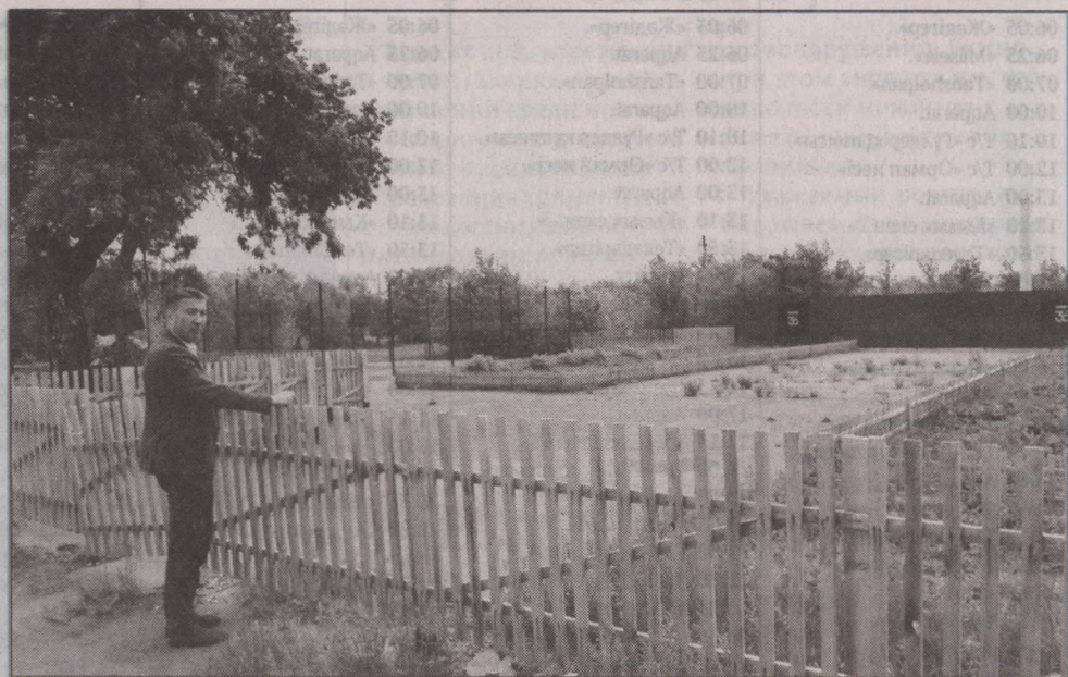
Благоустройство парка проводится за счет привлеченных средств

ставляю без школы. Как можно ее не любить? - с улыбкой говорит директор. - И свой предмет географию я очень люблю, за время работы выпустила немало успешных учеников, которые занимали высокие места по предмету.