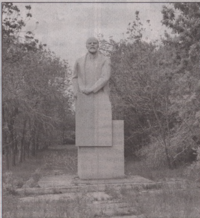
В селе Молодежное сохранился памятник Ленину