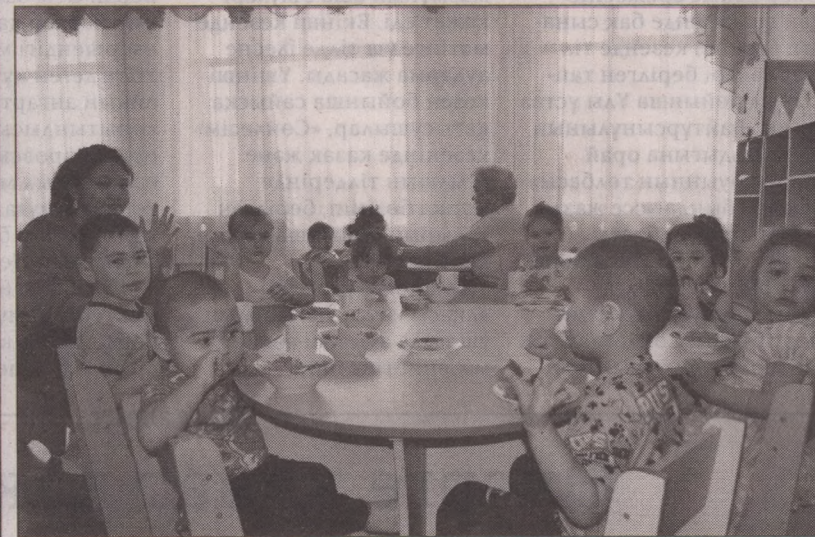
Воспитанников мини-центра мы застали за обедом