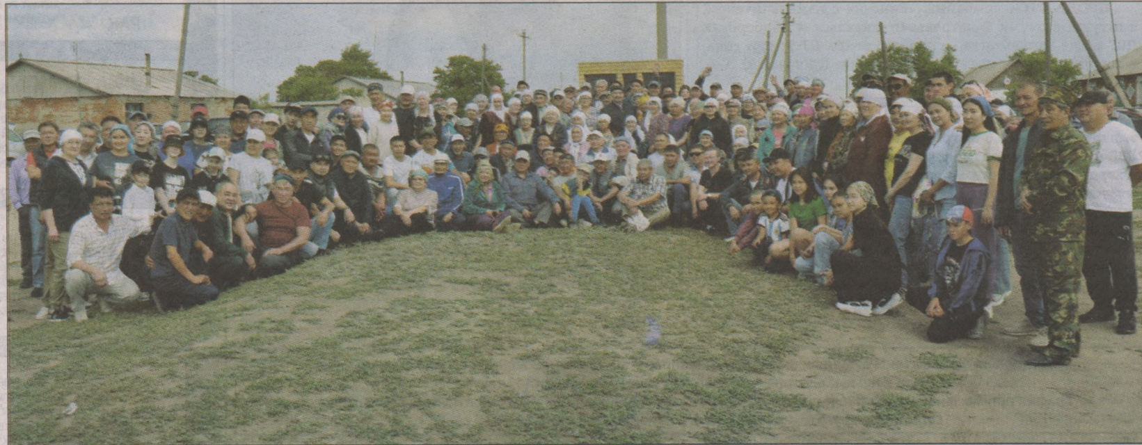
Туған жерде жүз қауыштырған алқаулықтар