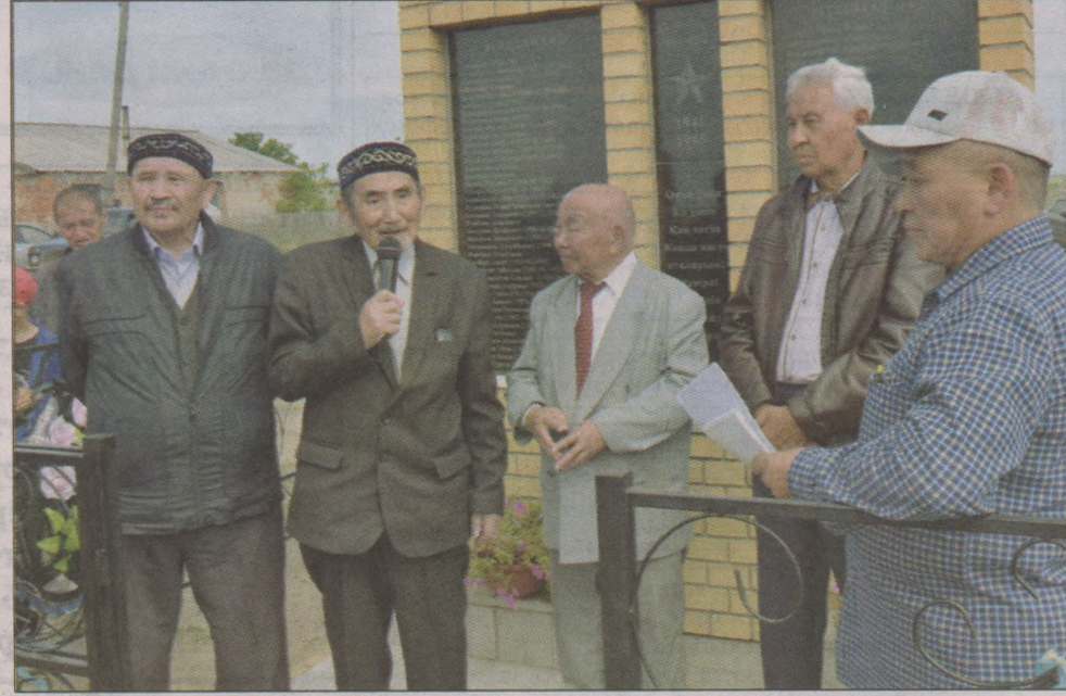
Ауыл ардагерлері ізгі тілектерімен бөлісіп, бата берілді