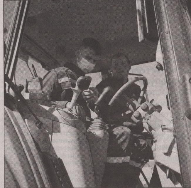
Тракторист-машинист – это пользователь, который без специального оборудования не сможет выявить неисправность