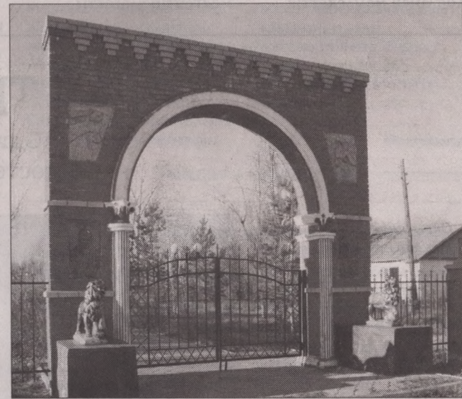
Центральный парк с. Харьковское

- Чтобы привезти необходимые лекарства, раньше просили таксистов, а теперь не все можно купить, требуется рецепт. Чтобы его получить, нужно сдать анализы, записаться на прием (зачастую очередь на неделю вперед), еще нужно оплатить дорогу