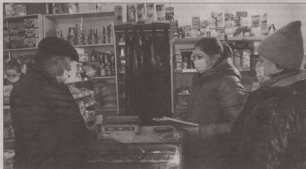
Магазин «Наурыз» - самый популярный для местных жителей