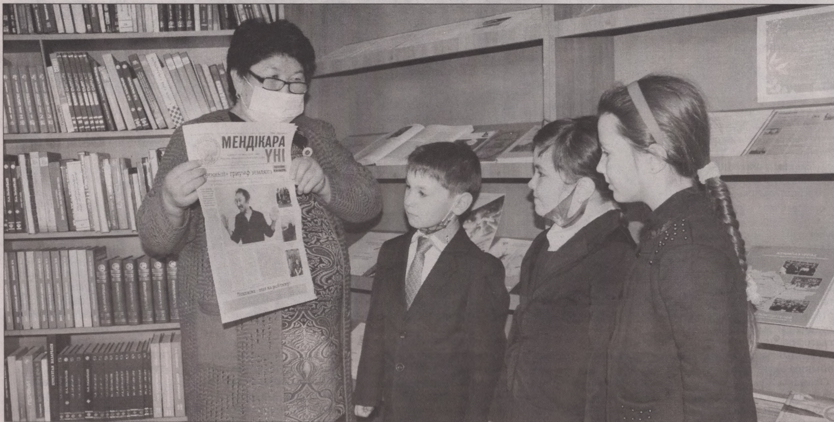
Школьники с удовольствием посещают модельную сельскую библиотеку

У Харьковского громкая биография, на весь регион и республику прославилось своими героями. Здесь проживал Герой Советского Союза, летчик Николай Куликов и кавале-